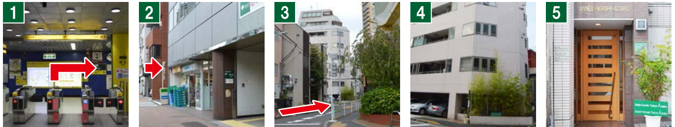
1 駅改札口を出て右方面へ30m、エスカレーター/エレベーターで地上へ。 2 地上口の右側にあるファミリーマートの角を右折。 3 2ブロック約80m進む。 4 竹の植栽のある白いビル 5 階段右側に入口があります。